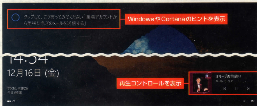
図3 背景を「画像」にしたロック画面。利用上のヒントも表示できる。音楽を再生中の「Grooveミュージック」の再生コントロールも表示されている