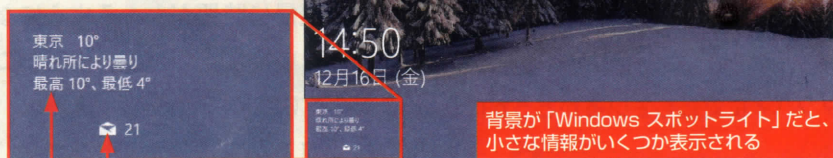
図1 Windows 10ではロック画面にアプリの新着情報を表示できる。ここでは「天気」の詳細情報と、「メール」の簡易表示を組み合わせた