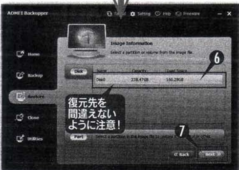
図7 復元対象のディスクを選ぶ。⑥で対象ディスクを選択し、⑦ [Next] をクリック。復元するとドライブ内が書き換えられるので慎重に行おう。

図6 バックアップファイルから④復元するディスクを選んで、⑤ [Next] をクリック。