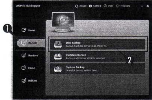
図1 システムやソフトウェア、作成ファイルなどをひとまとめにしてバックアップするには① [Backup] → ② [Disk Backup] をクリック。