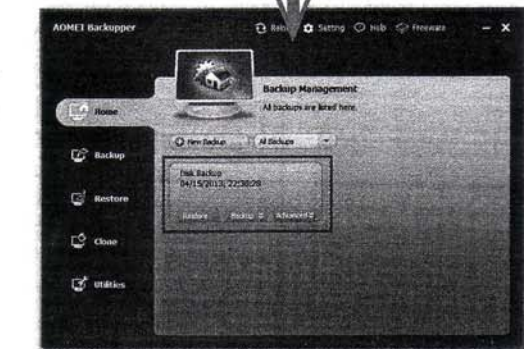
図4 バックアップが完成。利用可能なバックアップはまとめてホーム画面に表示される。バックアップファイルの移動や削除もできる。

図3 ディスク内情報が表示されるので、④バックアップ対象のディスクをクリックする。⑤ [Add] をクリックすると【図2】の画面に戻る。⑥ [Start Backup] をクリックするとバックアップが始まる。