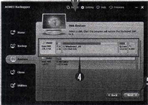
図6 バックアップファイルから④復元するディスクを選んで、⑤ [Next] をクリック。

図5 作成したバックアップは本ソフトの復元機能で元に戻すことができる。① [Restore] をクリックして、②バックアップファイルを選び、③ [Next] をクリック。