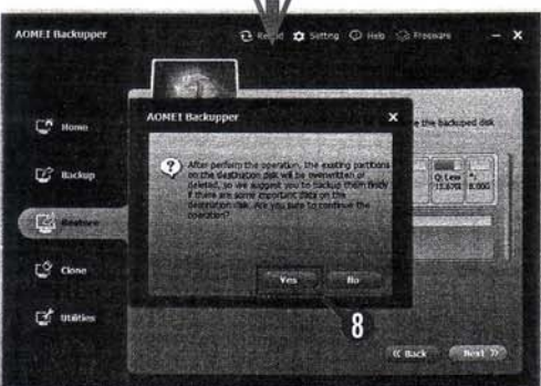
図8 [Yes] を選択すると復元が始まる。USBメモリや外付けHDDに対してもバックアップや復元を行える。

図7 復元対象のディスクを選ぶ。⑥で対象ディスクを選択し、⑦ [Next] をクリック。復元するとドライブ内が書き換えられるので慎重に行おう。