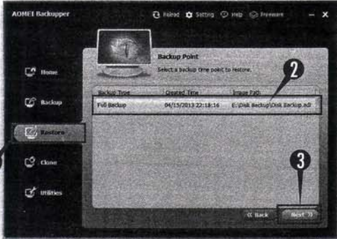
図5 作成したバックアップは本ソフトの復元機能で元に戻すことができる。① [Restore] をクリックして、②バックアップファイルを選び、③ [Next] をクリック。