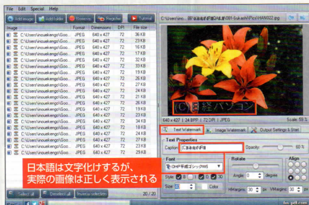
図1 画面左側に画像ファイルドラッグ・アンド・ドロップしたら、画面右側の「Text Watermark」タブで文字やフォント、サイズなどを設定する。日本語フォントを指定すれば、日本語も表示できる

図2 画面右側にある「Output Settings & Start」というタブの「Output Folder」で出力先フォルダーを指定して「Start」ボタンをクリックする