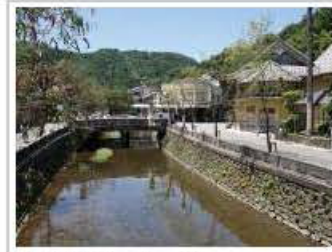
城崎温泉(イメージ)