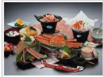
昼食(一例・イメージ)