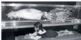
長さ3m! 深海のモンスター・ダイオウイカ

萩の魚や貝や虫などさま ざまな標本が登場し、 「驚異の真実」を披露。 それらを楽しむうち、 いきものに対するあな たのイメージはガラリ と変わります。この部 屋でいきものに興味を もったら、いよいよ本物の萩 の海と大地へさがしに出かけ てみましょう。