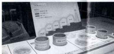
萩学なんでもボックス

実際に資料に触り、映像や音を見て聴いて、 萩について様々な分野から再発見できます。