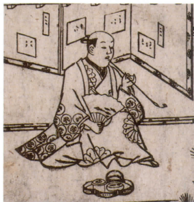
菱川師宣 (鹿野武左衛門口伝咄より)