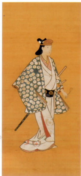
歌舞伎若衆図 菱川派