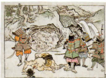
大江山 四天王と鬼