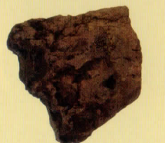
スコリア 火山の島、大根島の石の一つ