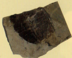
スッポン科の甲羅 年代は約 2000~1700 万年前