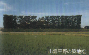
出雲平野の築地松