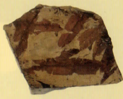
柳の仲間 年代は約 2000~1700 万年前