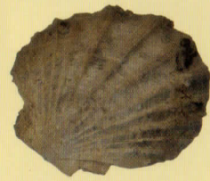
モニワホタテ 年代は約 1500~1400 万年前