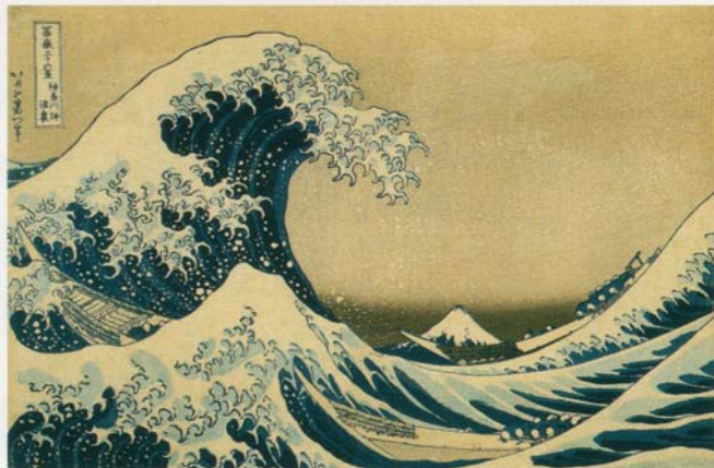
(図2) 北齋改爲一筆(1760-1849) 富嶽三十六景 神奈川沖浪裏 (plate2) Katsushika Hokusai (1760-1849) Fugaku Sanjuu-rokkei (36 views of Mt. Fuji) Kanagawa Oki Nami-ura ('Great Wave off Kanagawa') The museum building is modeled after 'Great Wave'.

E-mail: info@japan-ukiyo-e-museum.com URL: japan-ukiyo-e-museum.com/