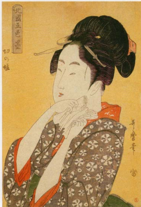
(図1) 哥磨筆(1750-1806) 北國五色墨切の娘 (plate1) Bijin-ga of Kitagawa Utamaro (1750-1806)