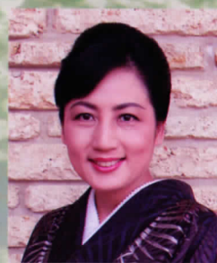
鹿児島県奄美パーク園長 田中一村記念美術館長

手つかずの自然とすばらしい人情と独特の地域文化と。奄美には、失われつつある人間としての大切なものが、まだ確かに息づいています。心の洗濯、そして自分探しの場としても、きっと何かが見つかるでしょう。