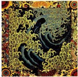
上町祭屋台天井絵「怒濤」図(男浪)