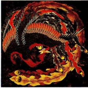
東町祭屋台天井絵「鳳凰」図