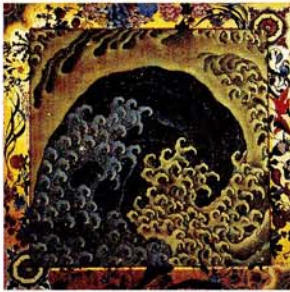
上町祭屋台天井絵「怒濤」図(女浪)

小布施は、江戸の浮世絵師・葛飾北斎（1760～1849）が晩年に逗留し、画業の集大成をはかった特別な場所です。