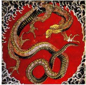
東町祭屋台天井絵「龍」図