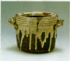
薫灰釉流 耳付水指(筑前・高取窯)