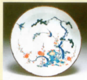
色絵松竹梅岩鳥文輪花皿 (1670～1690年代)