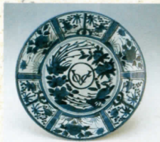
染付芙蓉手鳳凰文大皿：VOC銘