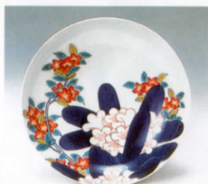
▲色絵石楠花薔薇文皿 (鍋島藩窯)