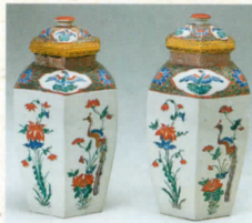
色絵花鳥文六角壺(柿右衛門様式)