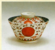
色絵 赤玉瑠璃文 蓋付碗 (1720～1760年代)