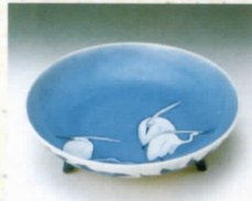
染付藍文三脚付皿(鍋島藩窯) 重要文化財