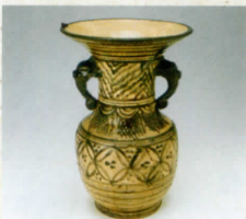
染付宋胡録写耳付花生(薩摩・苗代川窯)