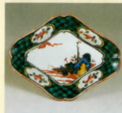
色絵舟人物文菱形小皿 (1650～1660年代)