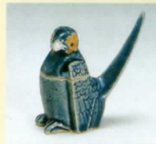
琉璃軸 鳥形合子 (1630～1640年代)