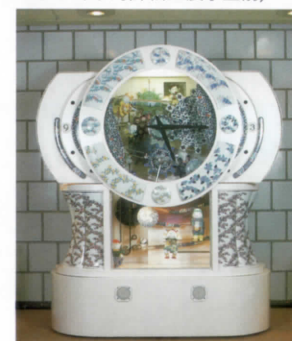
▼からくり時計(第2展示室前)