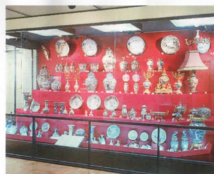
▲蒲原コレクション(有田町寄託)

九州陶磁の学習室。やきものの歴史と特色をわかりやすく紹介しています。また蒲原コレクションの輸出伊万里は圧巻。