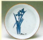
染付 菖蒲文皿 (1670～1690年代)