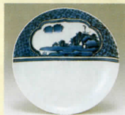
染付 山水七宝文皿 (1655～1670年代)