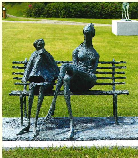
ローマの公園(1976年) Park in Rome