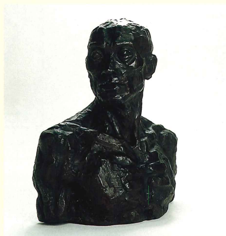
男の胸像(1929年) Bust of a Man