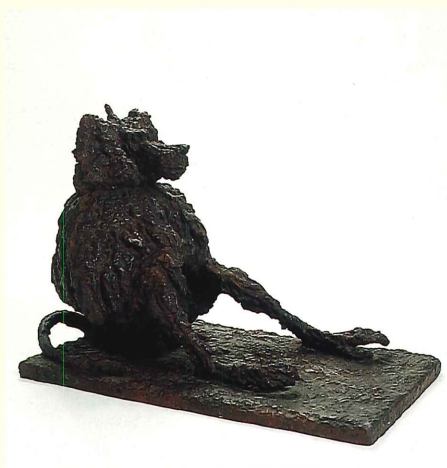
聖マントヒビ(1966年) Sacred Baboon