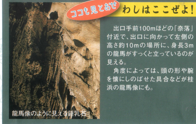
龍馬像のように見える鍾乳石

これが正に自然と時間の創る芸術品、高さ11m洞内最大の鍾乳石です。すぐ右側の絞り幕と名付けられた高さ6mの絞り上げたカーテンのような鍾乳石との調和は見事なものです。