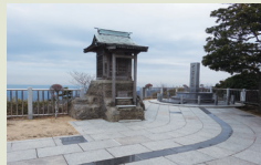
十州一覽台(浅間神社)