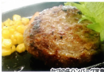
かつの牛ハンバーグ定食