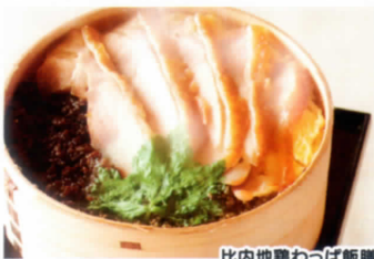
比内地鶏わっぱ飯膳