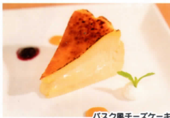
バスク風チーズケーキ