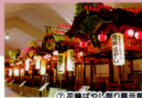
⑦ 花輪ばやし祭り展示館