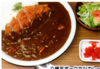
八幡平ポークカツカレー