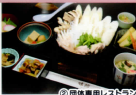
② 団体専用レストラン