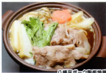
八幡平ポーク陶板焼