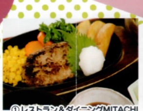
① レストラン＆ダイニングMITACHI