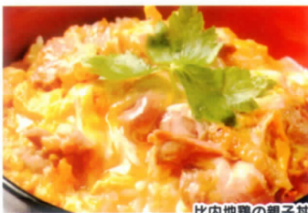
比内地鶏の親子丼