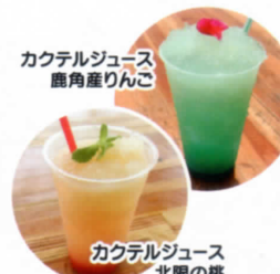
カクテルジュース 鹿角産りんご