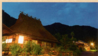
日も暮れかやぶき民家に灯りがともると、えも言われぬ郷愁がこみ上げてきます。