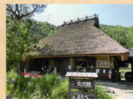
カフェ・ギャラリー彩花