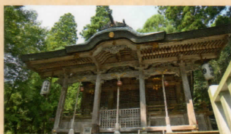
知井八幡神社の本殿は江戸中期の作で、京都府登録文化財です。