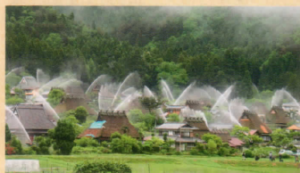
類焼防止のため全戸に放水銃を設置し、春と秋に点検の一斉放水を行います。

ホームページから ●美山町観光協会 http://www.miyamanavi.net/ 情報が得られます。 ●有限会社かやぶきの里 http://www.kayabukinosato.com/