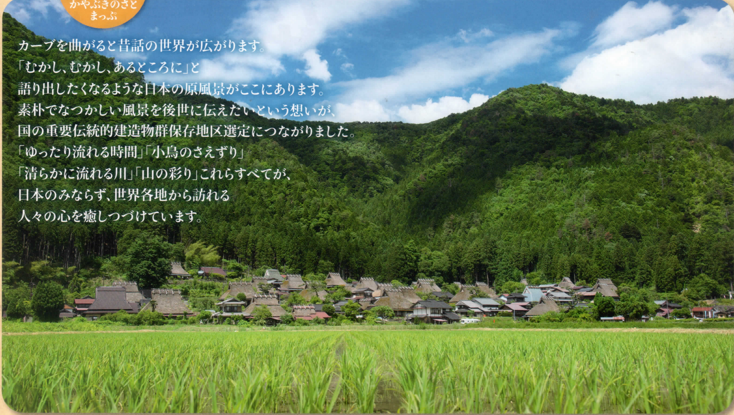
国の重要伝統的建造物群保存地区〈北集落〉