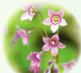
■サクラソウモドキ 5月下旬～6月中旬