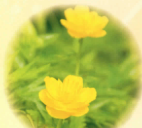
■レブンキンパイソウ 6月中旬～7月中旬