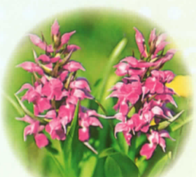
■ハクサンチドリ 5月中旬～6月上旬