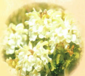
■ネムロシオガマ 6月上旬～中旬