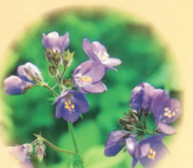
■レブンハナシロ 6月～7月下旬