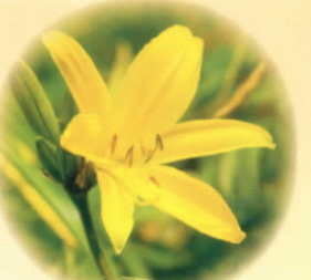
■エソカシュ 6月下旬～7月中旬