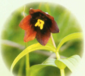
■クロユリ 5月下旬～6月中旬