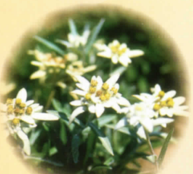
■レブンウスキソウ 6月～8月