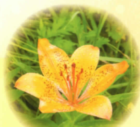
■エソスカシュリ 6月下旬～7月上旬