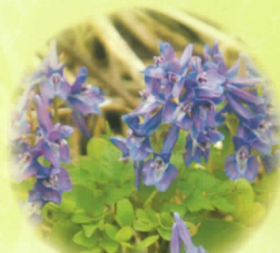
■エンジョサク 4月～5月