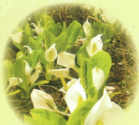
■ミズバショウ 4月下旬～5月上旬