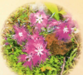
■タカネナデシコ 7月上旬～8月上旬