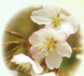
■チシマサクラ 5月～6月