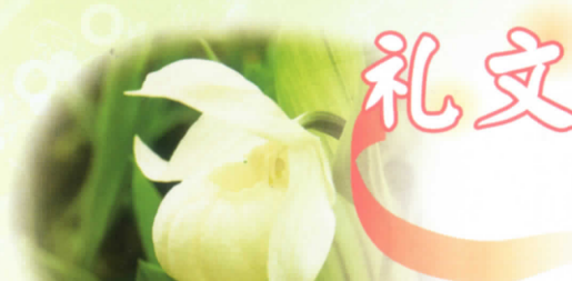
■レブンアツモリソウ 5月下旬～6月中旬