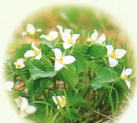
■オオハナノエンレイソウ 5月中旬～6月中旬