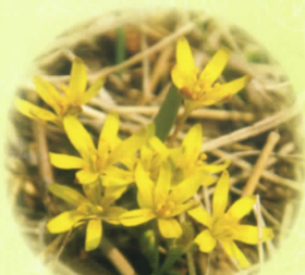
■キバナノアマナ 4月～5月