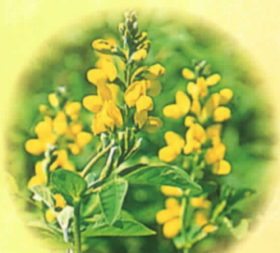
■センダイハギ 6月上旬～中旬