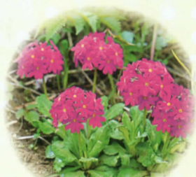
■レブンヨザクラ 5月中旬～6月