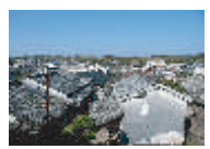
お蔵ん坂の上から望む石垣の町並み

古き良き港町石垣まち歩き 所要時間 約30分 その昔、貿易で栄えた石垣は豪商の跡が色濃く残る隠れ家のなまちで、映画「男はつらいよ」の舞台にもなったところだ。 人情味あふれる商店街や、坂や裏路地が残る町並みをぶらぶらと散歩してみよう。 駐車場にもなる石垣ふるまじりには案内看板があり、まち歩きマップも手に入ります。