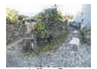
お蔵ん坂 米蔵が並んでいたことから名付けられた