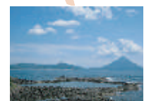
番所鼻公園：海の池

古き良き港町石垣まち歩き 所要時間 約30分 その昔、貿易で栄えた石垣は豪商の跡が色濃く残る隠れ家のなまちで、映画「男はつらいよ」の舞台にもなったところだ。 人情味あふれる商店街や、坂や裏路地が残る町並みをぶらぶらと散歩してみよう。 駐車場にもなる石垣ふるまじりには案内看板があり、まち歩きマップも手に入ります。