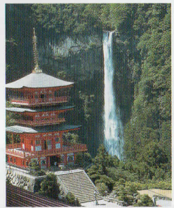
那智山青岸渡寺(三重塔) 那智大滝