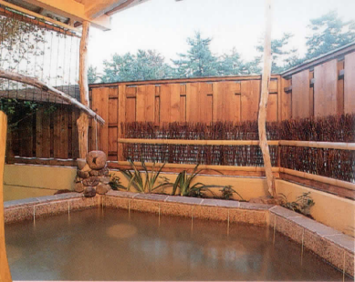
天の橋立運河沿いの流木露天風呂

身体を芯から温めて お肌をつるつるにする 良質の療養泉でございます。 心身共にリフレッシュ感をお楽しみください。