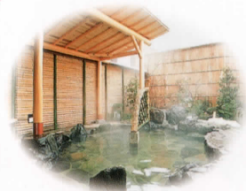
(姉妹宿) 文珠荘・茶庭風露天風呂 もご入浴いただけます。徒歩2分