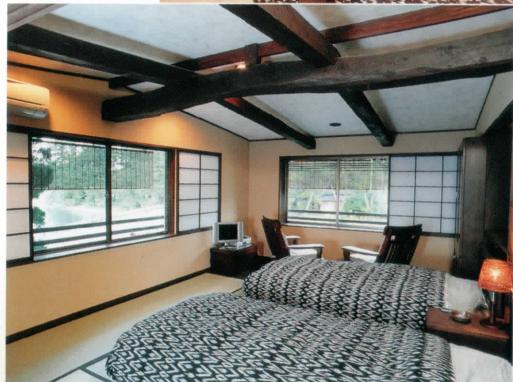
和のベッドルーム