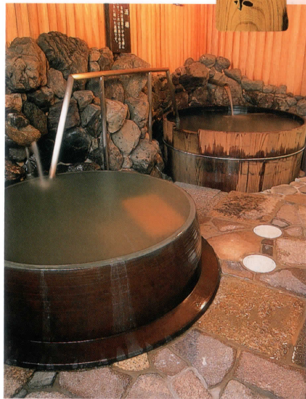
珍しい漁師釜風呂・酒樽風呂