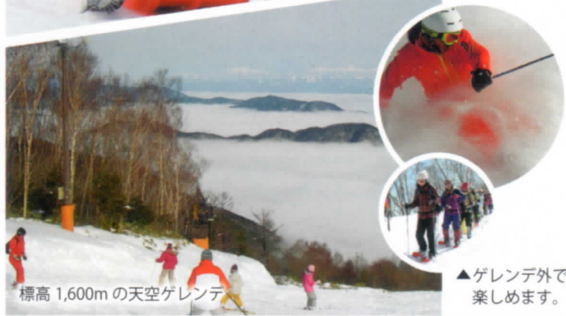
標高 1,600mの天空ゲレンデ