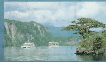
6 中山半島の先端にある「見返りの松」