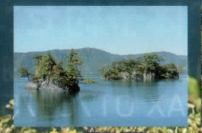
3 4 甲島鐘島