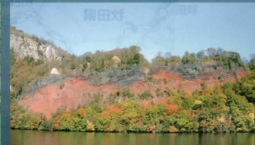
11 八之太郎の伝説を秘めた「五色岩」