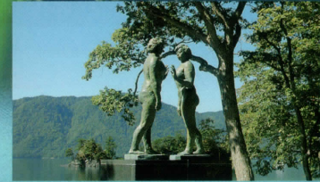
2 湖畔にたたずむ「乙女の像」

湖上遊覧でしか見られない美しい風景があります。 There is spectacular beauty that you can see only from the Excursion Boat.