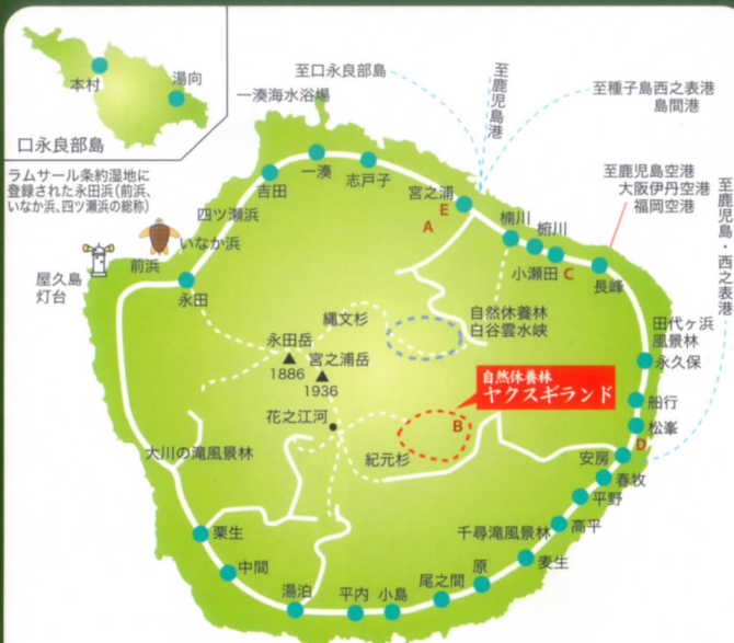
※地図上のA～Eは、下記お問い合わせ先の所在地です。