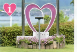
1 ハートのモニュメント 琵琶湖に見守られ、ハートの前でプロポーズをしよう！

みずの森はプロポーズにふさわしいロマンティックなスポットとして「恋人の聖地サテライト」に選定されています。