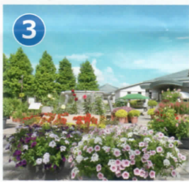
3 コミュニティ広場 広場の中央にある噴水は「水と人のふれあい」を表す当園のシンボルモニュメントです。プログラムによって噴水の出方が変化します。正面の花壇やハンギングバスケット・コンテナに植えられた四季折々の草花が彩りをそえます。