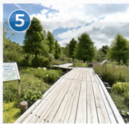
5 湿生花園 湿地を渡るハツ橋からはハナショウブ・スイショウ・ヤナギなど湿地の水生植物が観察できます。