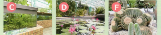
「ロータス」の名で総称されるハスやスイレンなどの水生植物のテーマ施設です。 A 園芸・緑化相談コーナー 水生植物やガーデニング、植物に関する資料を閲覧できます。園芸緑化など花と緑に関する相談も受け付けています。 B 映像ホール 臨場感あふれる200インチハイビジョン映像シアター。ハスとスイレンの様々な映像が、ロータスの奥深い世界を鮮やかに描きます。 C アクアリウム 水草の水中の様子が観察できます。琵琶湖の固有種・ネジレモの他、日本やアジアの水草を展示しています。 D アトリウム(温室) 熱帯原産の水生植物を中心に展示しています。中でも美しいのは、熱帯スイレンです。冬でも花が楽しめます。 E 常設展示室 オリエントに花開いたロータス文化や世界中のロータスアートに出会う「ロータスと美」のコーナー。ユニークな展示で人とロータスの結びつきを「科学」「文化」「芸術」等の視点から紹介します。 F サボテンエリア 50年以上かけて育った重さ100kg程の「金鯱(キンシャチ)」や、数十年に一度しか開花しない「フルクラエア・フォエチダ・メディオビクタ」など、見ごたえ抜群です。