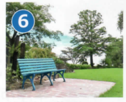
6 丘上の花園 珍しい草花を自然風に植栽しています。ガーデニングのお好きな方の人気スポットです。