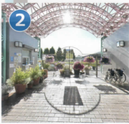
2 正面ゲート 券売機で入園券をお買い求めください。窓口では琵琶湖博物館との共通券も販売しております。