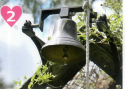
2 幸せの鐘 ガーデンウェディングの際に祝福の音を鳴り響かせます！