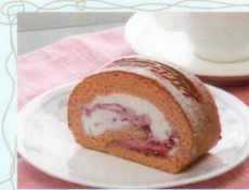
純生ロールケーキ