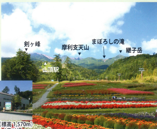
鹿ノ瀬駅（標高1,570m） ロープウェイ乗り場