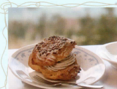
そばシュークリーム