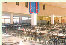
レストラン「ベルナル」(2F)