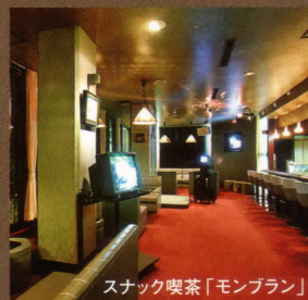
スナック喫茶「モンブラン」