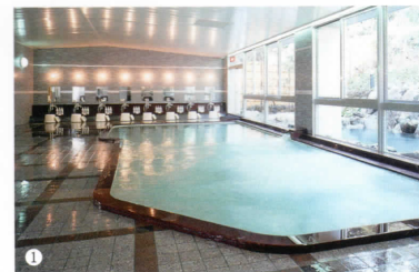
(左) 露天温泉岩風呂「玄海さつき温泉」/ Genkai Satsuki Onsen Open-air Hot Spring Rock Bath ① 温泉大浴場 (サウナ付) / Large Japanese Hot Spring Bath with Sauna