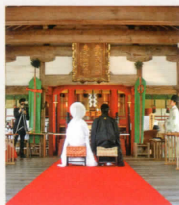
宗像大社の神殿で奉式

Munakata Taisha Shrine is dedicated to the ancestors of the imperial family. With its deities worshipped since ancient times as the gods of traffic, this shrine is mentioned in the Nihon Shoki ("Chronicles of Japan"), the country's second-oldest book.