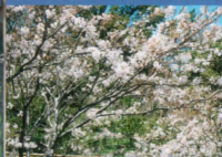
露天風呂から見上げた桜