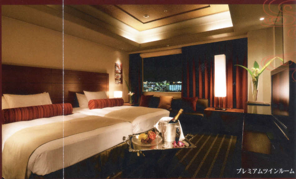
プレミアムツインルーム