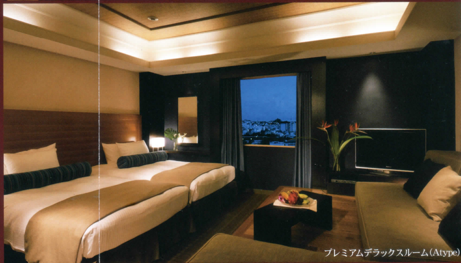
プレミアムデラックスルーム (Atype)