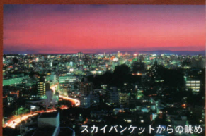
スカイバンケットからの眺め