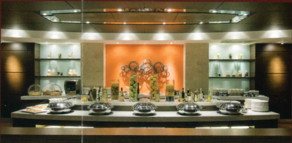
カフェレストラン アヴァンセ