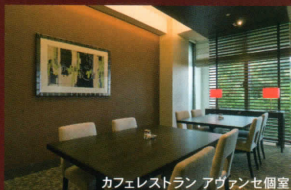
カフェレストラン アヴァンセ個室