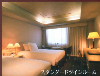
スタンダードツインルーム