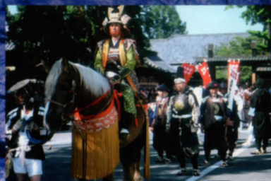
真田十万石まつり

昭和期の太平洋戦争末期には国家中枢機能と大本營の移転を目的に、地下壕が造られた地でもあります。