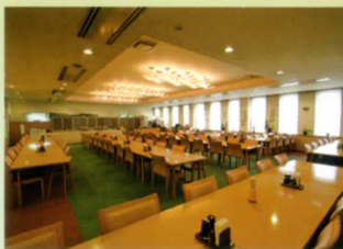
レストラン「皆神」(11:30~14:00 ラストオーダー13:30)