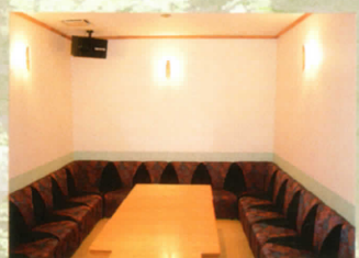
カラオケルーム「華」