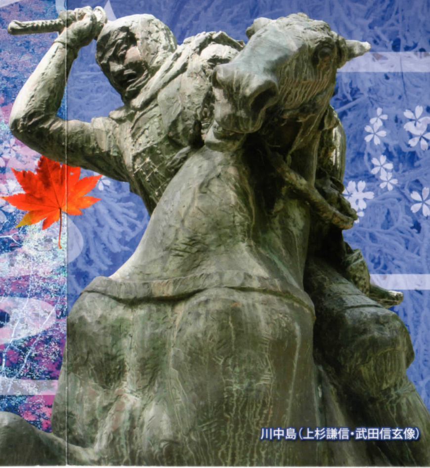
川中島(上杉謙信・武田信玄像)