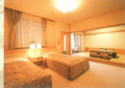
特別室(和洋) (バリアフリー、バス・トイレ完備)