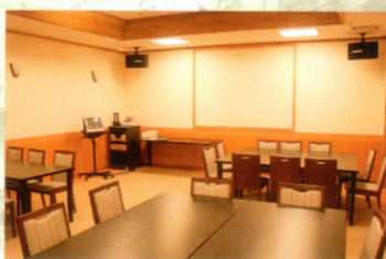
多目的ルーム「雅」(通信カラオケ完備)