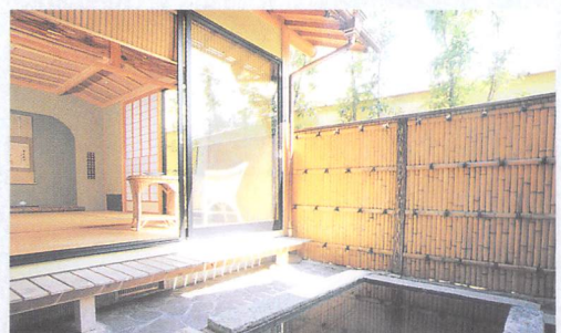
露天風呂付のお部屋

朝霧と湯煙の向こうに 由布岳を望む露天風呂で 清々しい朝を満喫。 風情と趣に満ちた館内は 落ち着いた気分になさせてくれます。 お部屋では日頃の喧騒を忘れ 心ゆくまでお寛ぎください。 時がゆっくり過ぎるのを感じながら 心と体を芯から癒していただけます。