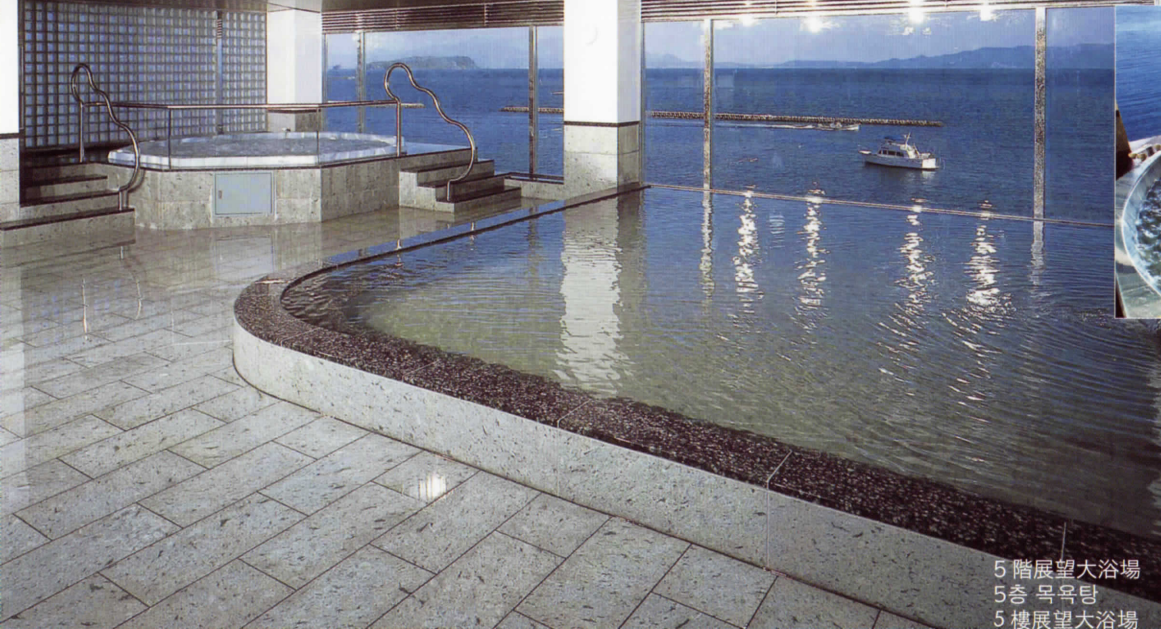
5階展望大浴場 5층 목욕탕 5樓展望大浴場