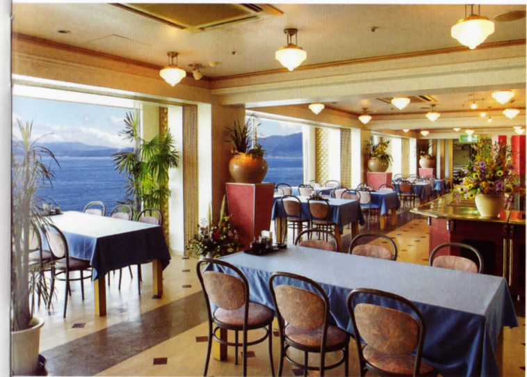
レストラン「フラミンゴ」 Restaurant "flamingo"