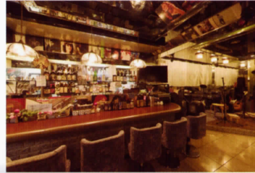
アコースティックバー「シルクロード」

居酒屋、喫茶、バー、 売店、プールなど 趣きさまざまに旅のひと時を ごゆっくりと お過ごしください。