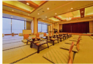
宴会場「錦江湾の間」