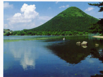
九州最大の湖 池田湖 〈車で約30分〉