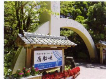
唐船峡そうめん流し 〈車で約40分〉