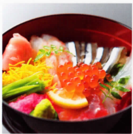
西郷丼 西郷隆盛にちなんだ バラエティー豊かな丼です。