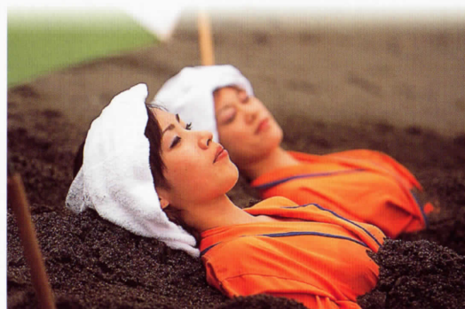
砂むし温泉〈税別 1,000円〉 모래 침질〈세금 포함 1000엔〉 砂浴〈不含税 1000日圓〉