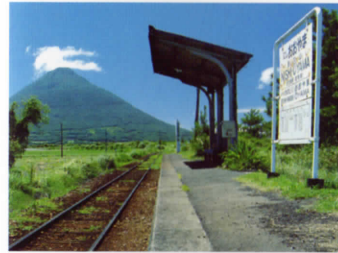
JR日本最南端の駅 西大山駅〈車で約20分〉