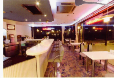
喫茶&ワイン「ロイヤル」