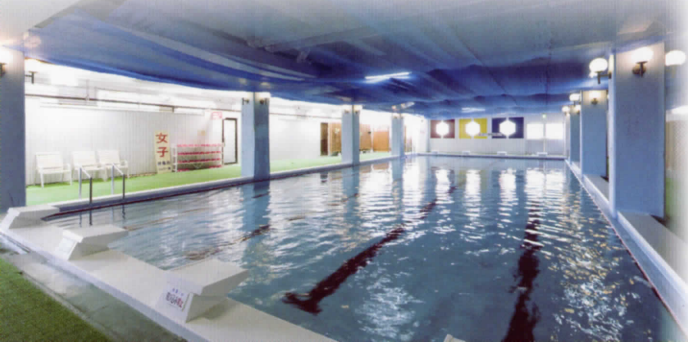
屋内プール 〈夏期(7月中旬頃～8月末)のみ営業〉