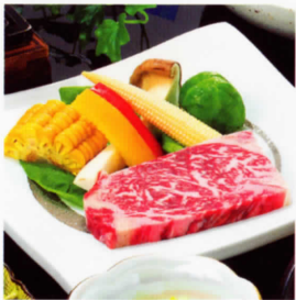
黒毛和牛ステーキ 鹿児島黒毛和牛ならではの 絶品の美味が味わえる。