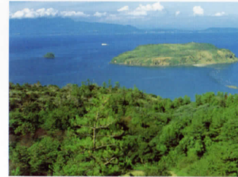
知林ヶ島〈車で約10分〉