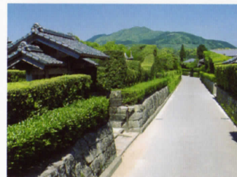
知覧 武家屋敷群 〈車で約60分〉

周辺には開聞岳や池田湖などの 南国ならではの自然と、明治維新で 活躍した西郷隆盛などの偉人の歴史を 感じさせる見所にあふれています。