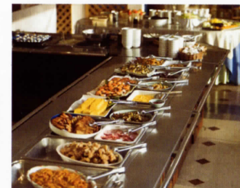
朝食バイキング Breakfast buffet-style