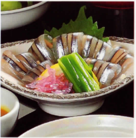
きびなご 手開きの刺身で 酢みそでいただきます。