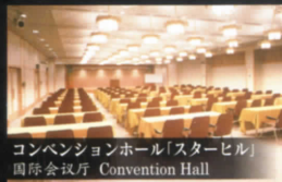
コンベンションホール「スターヒル」 国际会议厅 Convention Hall