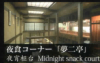
夜食コーナー「夢二亭」

Nature around make the mood breezy make meetings rich Like special conference room you can use many styles of room. Please spend significant time while enjoying the hot spring of the feeling to the full relaxedly.