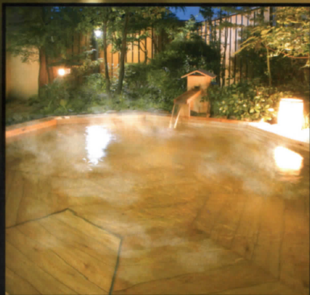
檜露天風呂 男性-「星月の湯」 女性-「花月の湯」