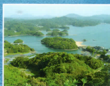
いろは島(肥前町) (ホテルから車で約60分)