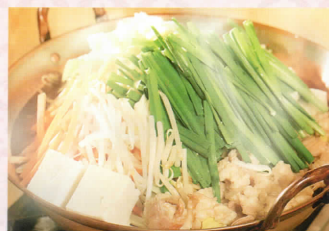
上からフランス料理、活イカ造り、もつ鍋