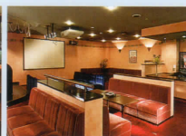
カラオケルーム「カナリア」 Canary Karaoke Bar