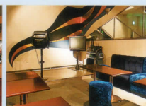
パティールーム「ミューズ」 Muse Party Room