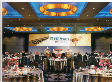
ロイヤルホール / 正餐