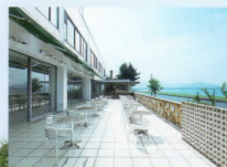
カフェ「レインボー」 Rainbow Cafe