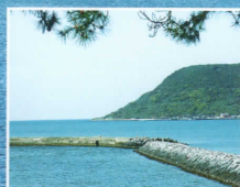
唐津城下の波止(釣場) (ホテルから車で約10分)