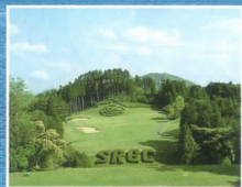
佐賀ロイヤルゴルフクラブ (ホテルから車で約20分)