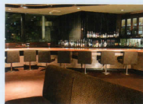
メインバー「マーメイド」 Mermaid Main Bar