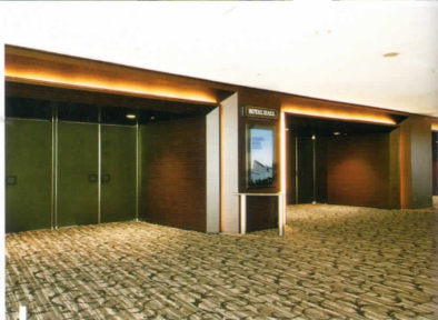
ロイヤルホールエントランス