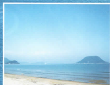
東の浜海水浴場 (ホテルから徒歩約5分)