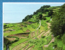
玄海町浜野浦の棚田 (ホテルから車で約35分)