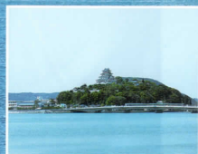
松浦川河口(釣場) (ホテル西側松浦川周辺)