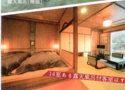
14室ある露天風呂付客室はすべて違う趣