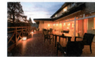
カフェテラス「朝霧」