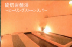
貸切岩盤浴 ～ヒーリングストーンスパ～