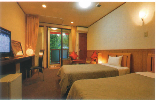
洋風タイプツインルーム・テラス露天風呂付