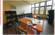
図書コーナー (インターネット可)