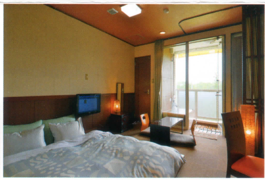
モダン和風タイプダブルルーム・テラス露天風呂付

テラスには自家源泉100%の温泉付、床から一段上がったフロアに、お布団を敷いてお休みいただけます。 お布団が3つのトリプルルームもございます。