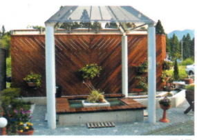
足湯 ホテルユーロシティ内の足湯(無料)