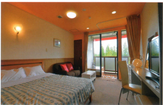
洋風タイプダブルルーム・テラス露天風呂付