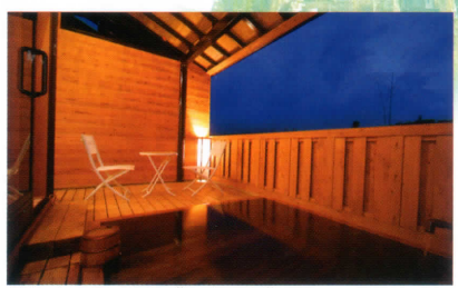
貸切専用露天風呂「星空の湯」 (50分 3,000円～「宿泊者2,400円～」)

TEL 0288-53-0500 FAX 0288-53-2750 〒321-1421 栃木県日光市所野1550-38 http://www.nikko-casual.jp/ 交通 JR日光駅 又は東武日光駅よりお車で2～3分 日光宇都宮有料道路日光インターチェンジより5分