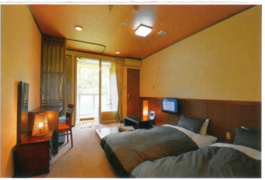
モダン和風タイプツインルーム・テラス露天風呂付