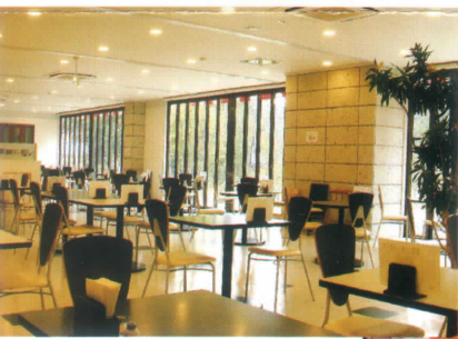
広々と明るくカジュアルなレストラン