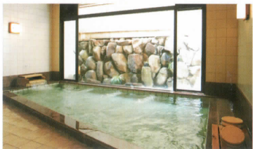
桜の湯(ジェットバス付)