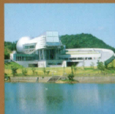
佐賀県立宇宙科学館