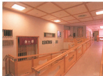
▲バリアフリーの館内

バリアフリー設計の新館は、「高齢者の方も安心して宿泊できる施設とサービスを備えた宿」として「シルバースター」に認定。例えば、車椅子での移動を配慮した廊下やお部屋の設計など、身体の不自由な方のご滞在に対応させていただいております。またベッド、シルバーカーもご用意いたしております。