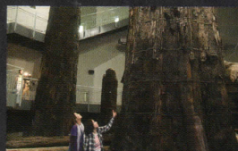
小豆原埋没林公園(車で20分)