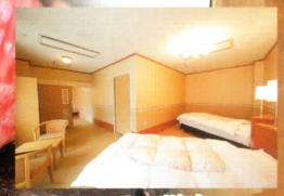
パリアフリー洋室