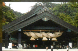
出雲大社神楽殿(車で1時間15分)