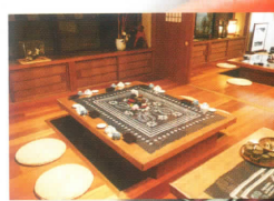
御食事処レンゲつつじ