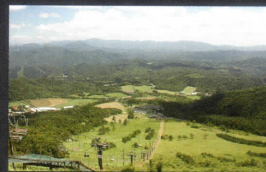
観光リフト(車で5分)