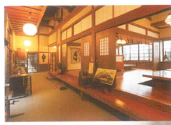
御食事処レンゲつつじ