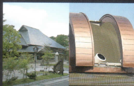
三瓶自然館サヒメル(車で10分)