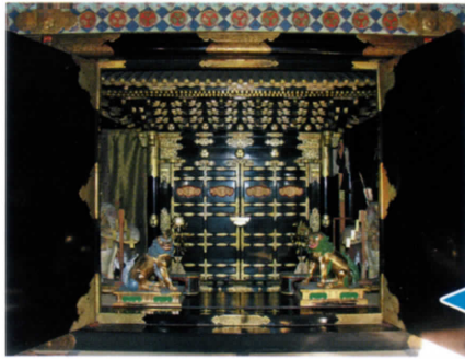
こくうでん 御宮殿 (本殿内)

御宮殿は、江戸城紅葉山御殿より奉遷されたと言われています。ここに、家康公がお祀りされ、隨身と狛犬が前面でお守りしています。