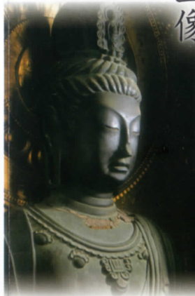
Gakkō Bosatsu (Hakuhō Period)

薬師如来は、浄瑠璃光世界の教主で、人々の災いや苦を除き、病を治し、寿命を伸ばし、薬を与え、正しい道を教える。高い宣字形裳懸座に結跏趺坐。通肩の大衣を着、左手は掌上にして薬壺を乗せ、右手は掌を前にかかげ五指を立てる。肉髻が低く、螺髪 （らせん髪） の粒が大きい。土形原型による鑄銅造り。