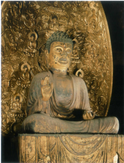
Yakushi Nyorai (Muromachi Period)