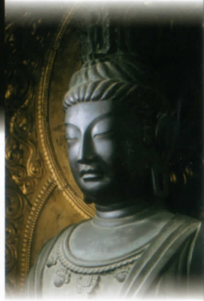
Nikkō Bosatsu (Hakuhō Period)