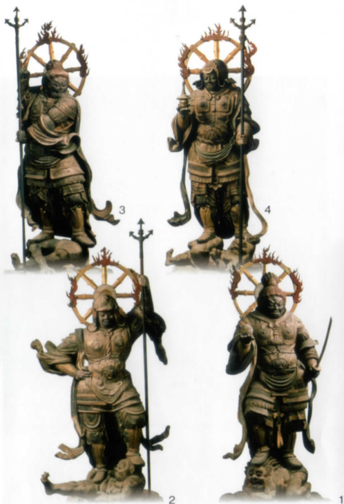
The Four Heavenly Kings (Heian Period)

国宝 木造 四天王立像 像高 153.0cm・164.0cm 素材 一木造 彩色 瞳は黒漆 9世紀・平安時代