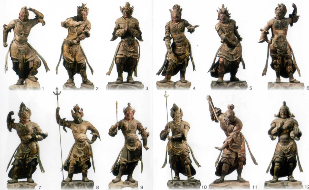
The Twelve Divine Generals (Kamakura Period)

国宝 木造 十二神将立像 像高 113.0・126.3cm 素材 寄木造 彩色 彫眼 13世紀初・鎌倉時代