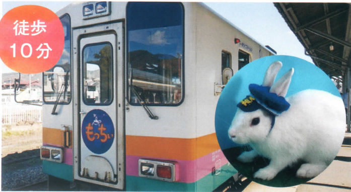
フラワー長井線 宮内駅 山形県南陽市宮内 2854-2 TEL:0238-40-0560

駅長がうさぎ?フラワー長井線 宮内駅の駅長は、メディアでも特集されているうさぎの"もちー"駅長です。