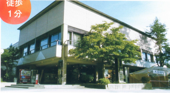
熊野大社 證誠殿 山形県南陽市宮内 3476-1 TEL:0238-47-2172

喫茶店・御手洗休憩・お土産等をご用意。お気軽に熊野大社会館をご利用ください。ご昼食をご希望の方は、事前にご予約ください。