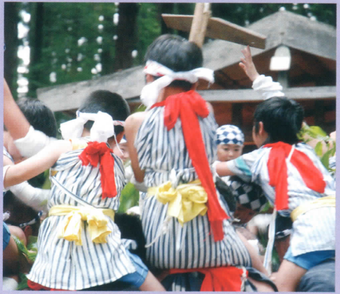
熊野大社に伝わる特別な神事「梵天ばよい」。大人の肩に乗った子供たちが、栗の葉で神様の力が宿った木を力強く叩きます。すすくと元気に育つよう執り行う歴史ある神事です。(7月25日 16:45分より)