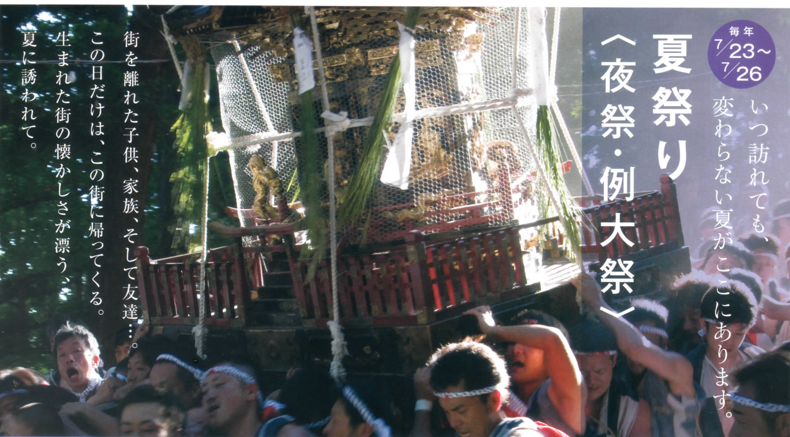
「わっしょい! わっしょい!」獅子冠事務所 若連による御神輿のおくだりの様子。24日は一晩、街の中心に安置され、25日には神社にお戻りいただきます。

街を離れた子供、家族、そして友達...。 この日だけは、この街に帰ってくる。 生まれた街の懐かしさが漂う、 夏に誘われて。