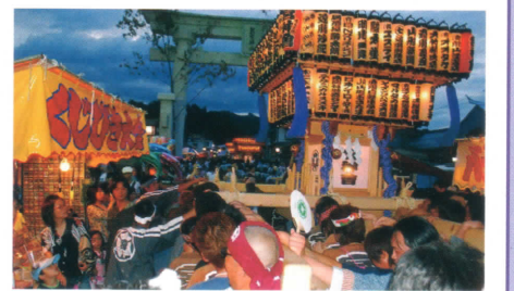
4基の万灯神輿が24日6時半に各地区を出発し、熊野大社を目指します。現在は、地元の中学生高校生も交え、大人から子供まで神輿を担ぎお祭りを盛り上げます。年々、参加していく方が増えています。