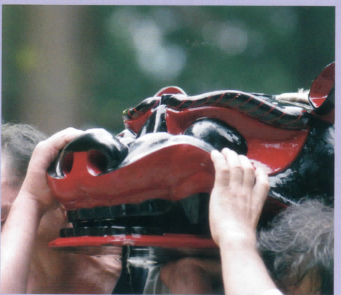
7月24日に行衣という特別な衣装を着た方々によって、神社から担がれ、勇壮な姿で出発。一晩だけ、特別にその姿を見せてくれます。25日は、昔から定められた場所で、舞を披露しながら神社へお戻りいただきます。

7月26日 9:00 総社祭。熊野大社境内の各神社に無事お祭りが終わったことを一社一社ご報告します。全ての神事がこれで終了します。