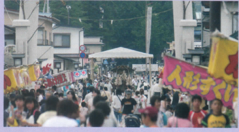
昼祭り・夜祭りの風景 熊野門前通りにはずらりと屋台が出店します。

毎年七月二十四日「夜祭」、そして二十五日の「例大祭」はもともと地域と根強く関わってきたお祭りです。特製の「行衣」 ぎょうい を着て、一般の方も熊野大社の御神輿やお獅子様の勇壮なお姿を間近で拝観できます。詳細のタイムスケジュールに合わせ、歴史ある熊野大社の夏祭りの醍醐味を味わってください。