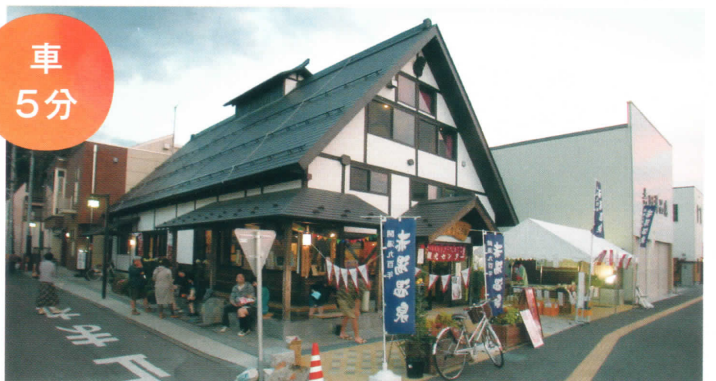
赤湯温泉街 山形県南陽市赤湯 754-2 TEL:0238-43-3114 ※各旅館詳細はお問合せ下さい。