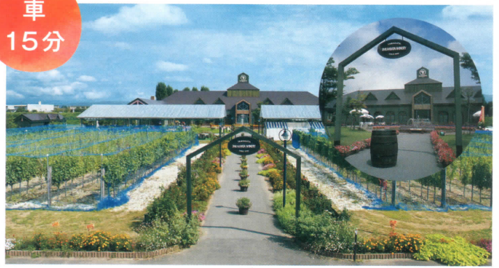
高畠ワイン 山形県東置賜郡高畠町大字糠野目 2700-1 TEL:0238-57-4800

国産ワインコンクール金賞受賞のワイナリー。家族でも楽しめる工場見学(無料)とワインの試飲・購入ができる。