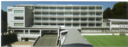
●成田高等学校・付属中学校・付属小学校

成田山は「浄財を浄所に」という歴代貫首の方針にもとづき、多くの社会事業を運営してきました。現在これらの事業は成田山教育・文化・福祉財団の3法人によって運営され、成田山の宗教的使命の達成と地方文化の向上に大いに業績をあげています。