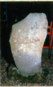
此の里は 息吹戸主の 風寒し 松尾芭蕉句碑