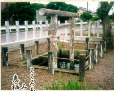
ここにある人に みせばや常陸なる 息栖の浜の 忍潮井の水