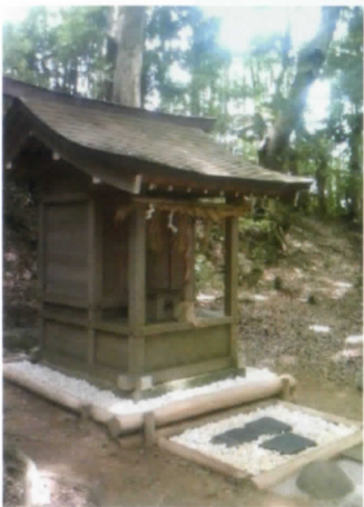
ことだまの杜「本宮」