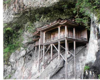
三佛寺奥院 投入堂(国宝) 附愛染堂

三徳山三佛寺の奥の院であり、日本でも代表的な懸造り建築。本尊は金剛蔵王大権現。堂全面は断崖で近づく道すらない垂直な崖に、浮かぶとも建つとも表現し難い優美な姿をかもしている。近年の科学的調査により、平安後期の作であるとされ、現存する神社建築では日本最古級ともいわれる。 慶雲三年(706)、役行者が法力をもって岩窟に投げ入れたといわれ、「投入堂」と人々は呼ぶようになったと伝わる。