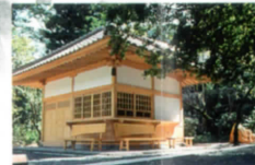
参詣者受付案内所 (お礼受与所)

お山に登られない方には、県道から投入堂が拝めます。川側にある橋を渡られると良く見えます。