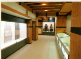
福知山城・明智、朽木氏関連資料を展示