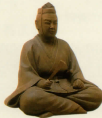
明智光秀木像 (日下寛治 作)