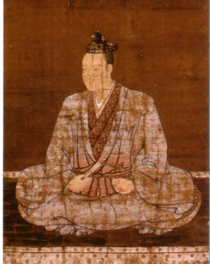
明智光秀画像 (大阪府岸和田市 本徳寺所蔵)

丹波支配にあたり、福知山の地に城を築き、城代として娘婿である明智秀満を入れました。また光秀は短い統治期間の中で、築城とあわせて地子銭の免除や治水事業を行うなど善政を行ったと伝えられます。光秀はほどなく、「本能寺の変」を引き起こし、「山崎合戦」の後、悲劇的な最期を迎えますが、福知山の民衆は光秀の事績を忘れることなく信奉し、「名君」として現在でも親しまれています。