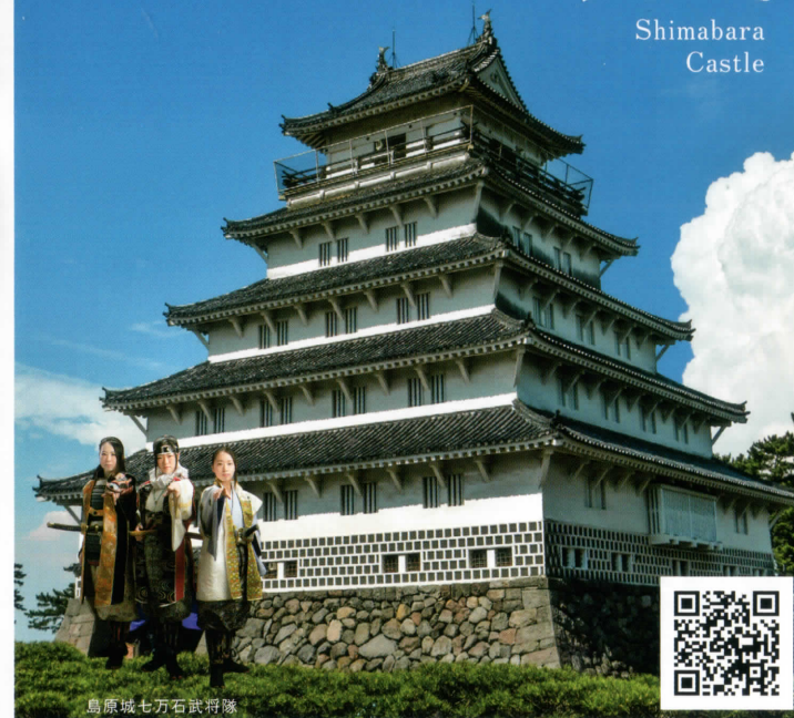
島原城七万石武將隊