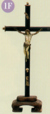
コレジオ祭壇十字架