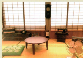
ハイカラさんが通るフォトスタジオ

特別展や季節イベントなどの展示スペース。ハイカラさんが通るフォトスタジオとしても使用しており、土日祝日限定で袴レンタルを実施しています。 10:00~16:30(最終受付15:30)