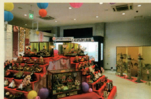
しまばら浪漫ひなめぐりん 2月上旬頃~