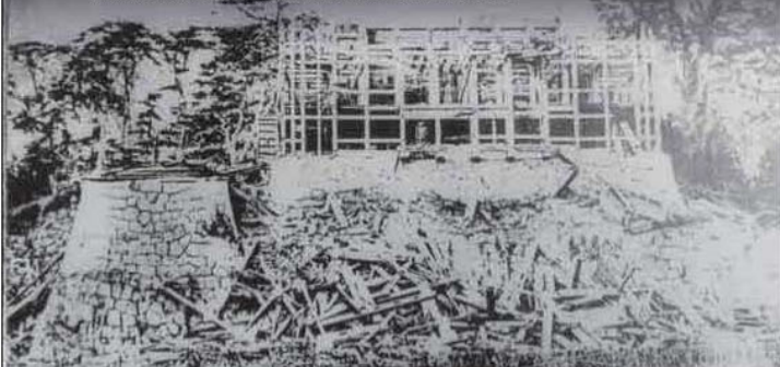
解体中の天守 明治3年(1870)頃