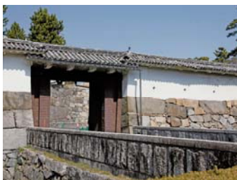
おもてにのもん 表二之門

規模・構造は東南隅櫓と同じですが、「石落し」の破風の形が異なります。平成22年度から解体修理を行っており、平成26年度完了の予定です。