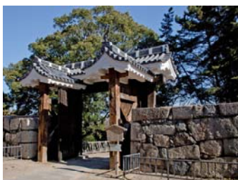
きゅうにのまる ひがしにのもん 旧二之丸 東二之門

本丸南側にあり、鉄板張りとし用材は木割りが太く堅固に造られています。袖塀は土塀で鉄砲狭間を開いています。