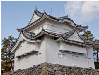
とうなんすみやぐら たつみ 東南隅櫓 (辰巳櫓)

本丸の南東隅にある屋根二重・内部三階の櫓。出窓には「石落し」が設けられています。かつては武具が納められていました。