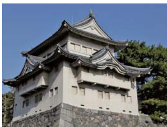
せいはんすみやぐら ひつじさる 西南隅櫓 (未申櫓)

屋根三重・内部三階の櫓。他の建物の古材を転用して建築されており、外部北面、西面に千鳥破風が作られ、「石落し」を備えています。