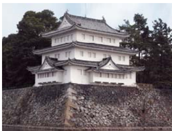
せいほくすみやぐら いぬい 西北隅櫓 (戌亥櫓・清須櫓)

本丸の南東隅にある屋根二重・内部三階の櫓。出窓には「石落し」が設けられています。かつては武具が納められていました。