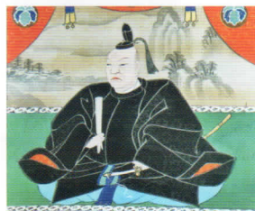
藤堂高虎公座像(部分) 〈前田呉耕画〉