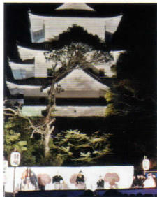
天守閣を背に薪能