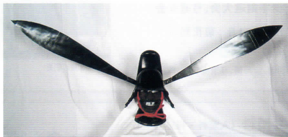
唐冠形兜 (三重県指定文化財・伊賀市所蔵)