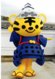
マスコットキャラクター た伊賀ーくん